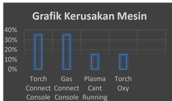
Gambar 4.3 Grafik Kerusakan Mesin AMG CNC Plate Cutting

Berdasarkan Grafik pada Gambar 4.3 dapat diketahui jenis Kerusakan pada Mesin AMG CNC Plate Cutting , jika dilihat dari nilai komulatifnya yang mendominasi berdasarkan dengan prinsip yang menyatakan 90/10 adalah 90% kerusakan terjadi karna 10% komponen mengalami error atau tidak sesuai standar sehingga yang 90% adalah dapat dijadikan acuan utama pada kerusakan mesin. Dapat diketahui 90% tersebut adalah TCC 35% dan GCC 35% serta Plasma Cant Running.